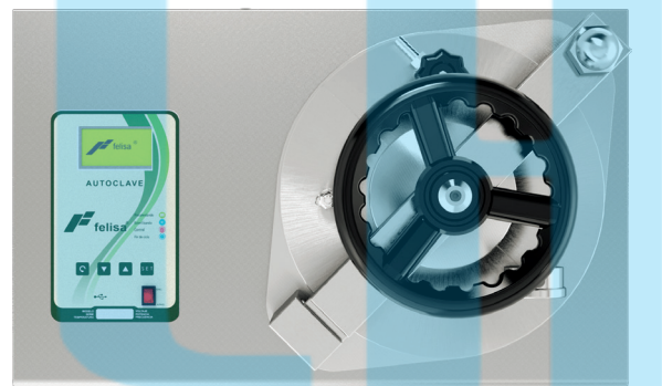
Vista superior de autoclave digital modelo FE-399 , de 66.0 x 40.0 cm y 101.0 cm de altura; capacidad de 40 litros. / Top view of digital autoclave model FE-399 , 66.0 x 40.0 cm and 101.0 cm high; 40 liter capacity.